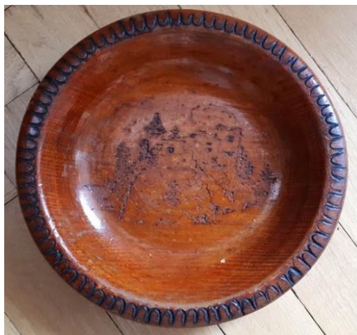
Výtvar Pacíka (vypalování je ošoupané, protože talíř používáme na chipsy)